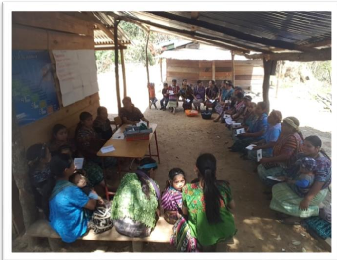
COSACRE funcionando con el acompañamiento de Cáritas Verapaz.

Las COSACRE deben instituir un fondo solidario. Conciertan una cotización fija que se aportará en todas las reuniones.