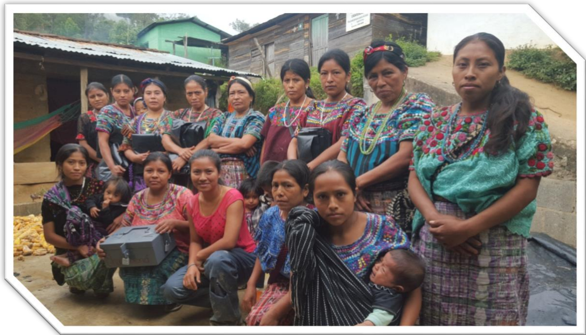
COSACRE de Mujeres, Baja Verapaz