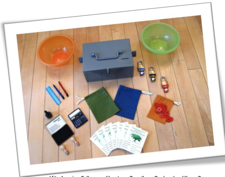
Kit: 1 caja, 3 llaves, libretas, 2 sellos, 2 almohadillas, 3 bolsas de diferente color, 3 candados y 1 calculadora.

Las Cosacre se deben constituir con 13 miembros, de preferencia; para recoger el símbolo de armonía y perfección de la cosmovisión Maya, esto puede interpretarse en el favor de las energías positivas o en la aprobación de toda la espiritualidad que acompaña a cada uno de los miembros de la Comunidad Solidaria. Esto da un equilibrio adecuado entre la creación de una reserva útil de capital y la buena planificación de las reuniones. Los miembros se seleccionan entre sí, generalmente entre la población adulta, pero la comunidad está totalmente libre para decidir quienes la conformarán. Se pueden organizar tanto hombres como mujeres, pero en caso de los grupos mixtos al menos tres de los cinco dirigentes deben ser mujeres. Los miembros que tienen ya un cargo de gobierno en su comunidad de origen, no son elegibles para asumir cargos de coordinación en esta Comunidad Solidaria de Ahorro.